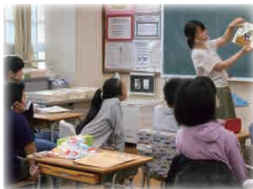
読み聞かせ (宮津市立府中小学校)