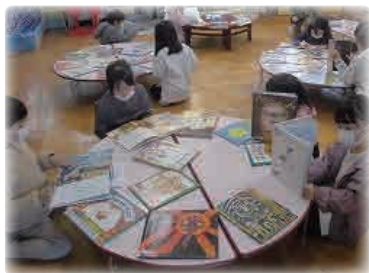
授業での活用 (京田辺市立田辺東小学校)

20～60冊の本をセットにして貸出すサービスです。調べ学習、読書、教室や図書室での貸出・展示などにご利用いただけます。