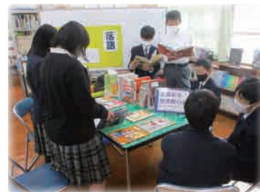
図書の展示 (南丹市立殿田中学校)

各テーマごとに最大8セットずつ用意しています。貸出期間は14週間以内です。 セットの見本を京都府総合教育センター及び北部研修所に展示しています。