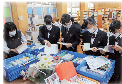
授業での活用 （府立網野高等学校／ 府立丹後緑風高等学校網野学舎）

各テーマごとに最大6セットずつ用意しています。 貸出期間は14週間以内、貸し出しできるセット数の上限は10セットです。 セットの見本を京都府総合教育センター及び北部研修所に展示しています。