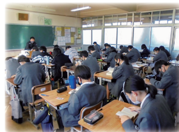
朝読書 (宇治市立木幡中学校)

各テーマごとに最大8セットずつ用意しています。貸出期間は14週間以内です。セットの見本を京都府総合教育センター及び北部研修所に展示しています。