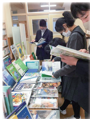
図書の展示 (伊根町立伊根中学校)