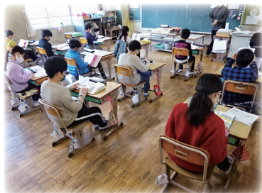
授業での活用 (舞鶴市立中舞鶴小学校)

20～60冊の本をセットにして貸し出すサービスです。調べ学習、読書、教室や図書室での貸出・展示などにご利用いただけます。