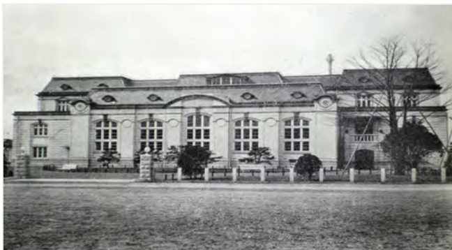
↑ 明治42（1909）年岡崎移転後の京都府立京都図書館

明治42（1909）年に、現在の岡崎に移転・開館して、今年で110周年を迎える京都府立図書館。その長きにわたる歴史を、貴重なパネル写真で辿ります。