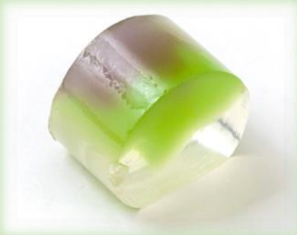
京菓子展 2018 年デザイン部門入選作 山田 ちなつ『夢幻』(京都精華大学)