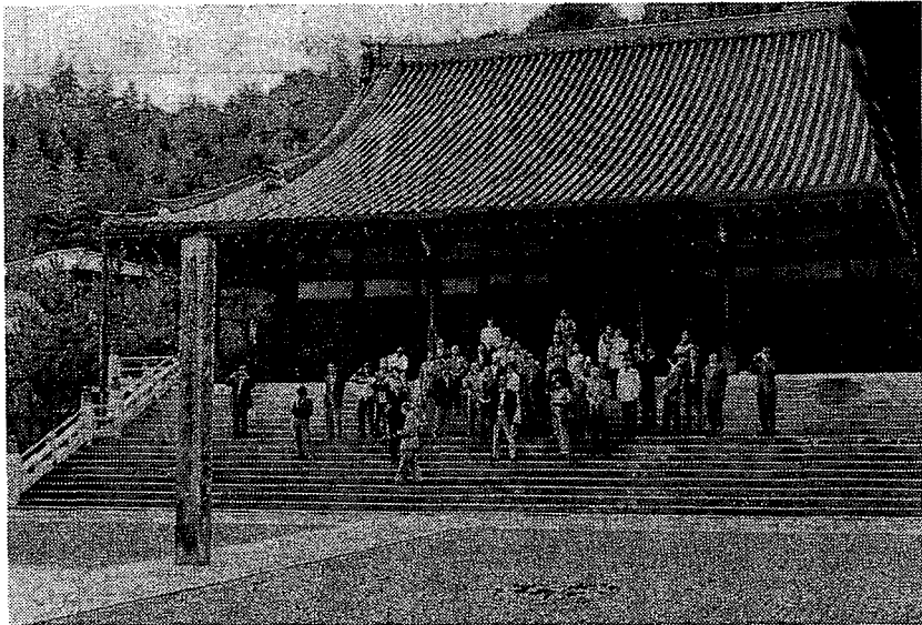
読書推進講座 文学散歩 妙満寺にて