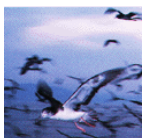
京都府の鳥 オオミスナギ ドリ

京都府開庁 100 年の記念行事の一環として刊行されました。京都府に関する雑誌論文約 13,000 件を収録しています。巻末に、地域索引・事項索引・著者名索引がありますので、関連の論文を探することができます。