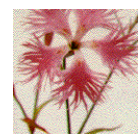
京都府の草花 なでしこ