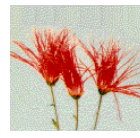
京都府の草花 嵯峨ざく