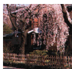
京都府の花 しだれ桜